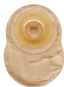
ESTEEM™ FLEX CONVEX UZAVRETÉ VRECKO NEPRIEHLADNÉ S FILTROM